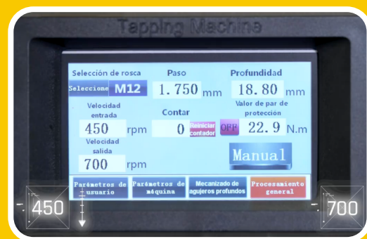
PANNELLO DI CONTROLLO TOUCH SCREEN