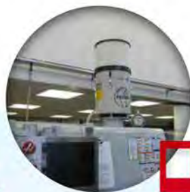
Centri di lavorazione a macchina