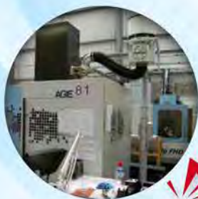
EDM / Electroerosione